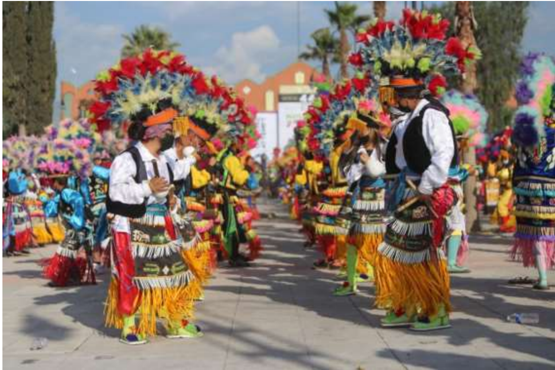
DANZA DE LOS MATLACHINES, SALTILLO, COAHUILA TRADICIÓN PREHISPÁNICA DE ORIGEN TLAXCALTECA