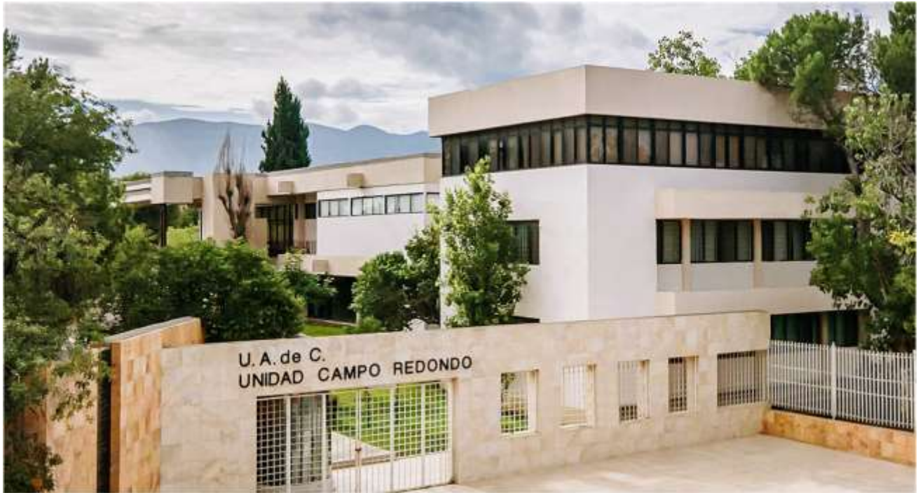
Universidad Autónoma de Coahuila, Unidad Campo Redondo